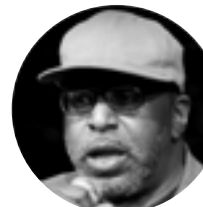
Minister Server Tavares

Профессор истории и международных отношений Trinity College (Коннектикут, США).